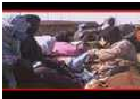
Il treno del ferro